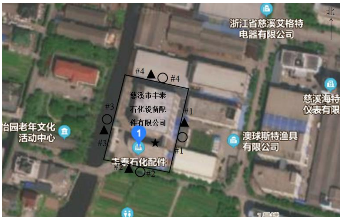
图 7-1 监测点位图