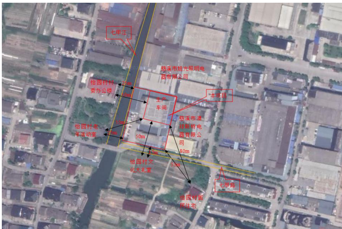
图 3-1 项目地理位置图