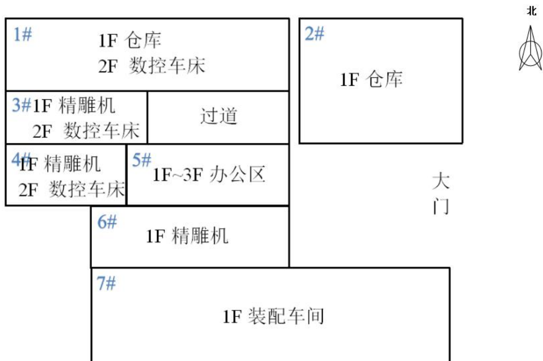
图 3-2 厂区平面布置图