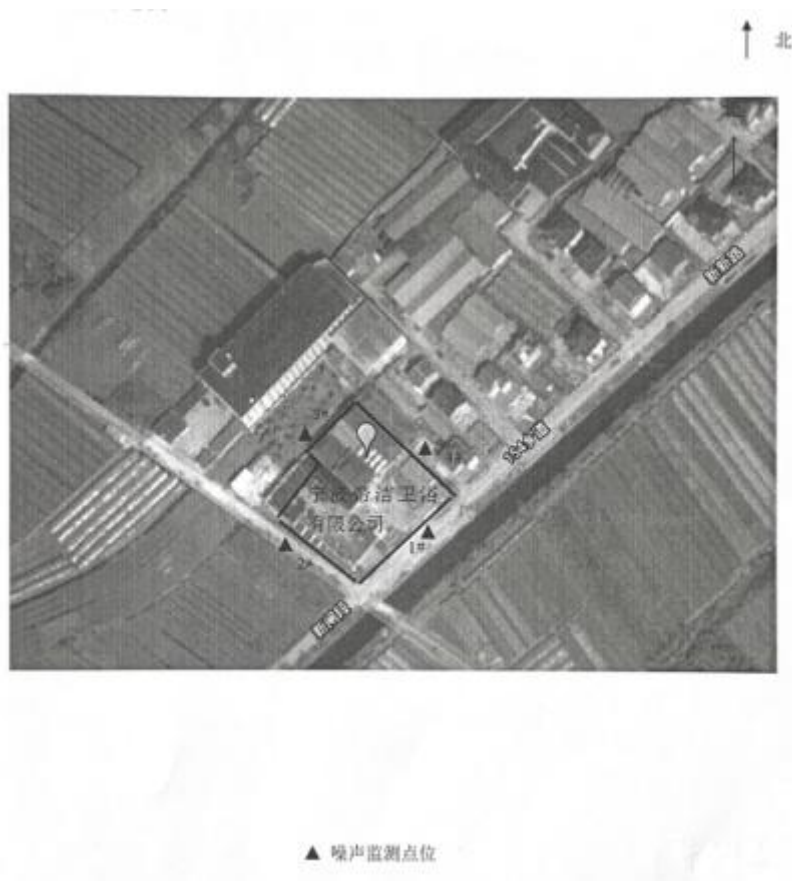
图 7-1 监测点位图