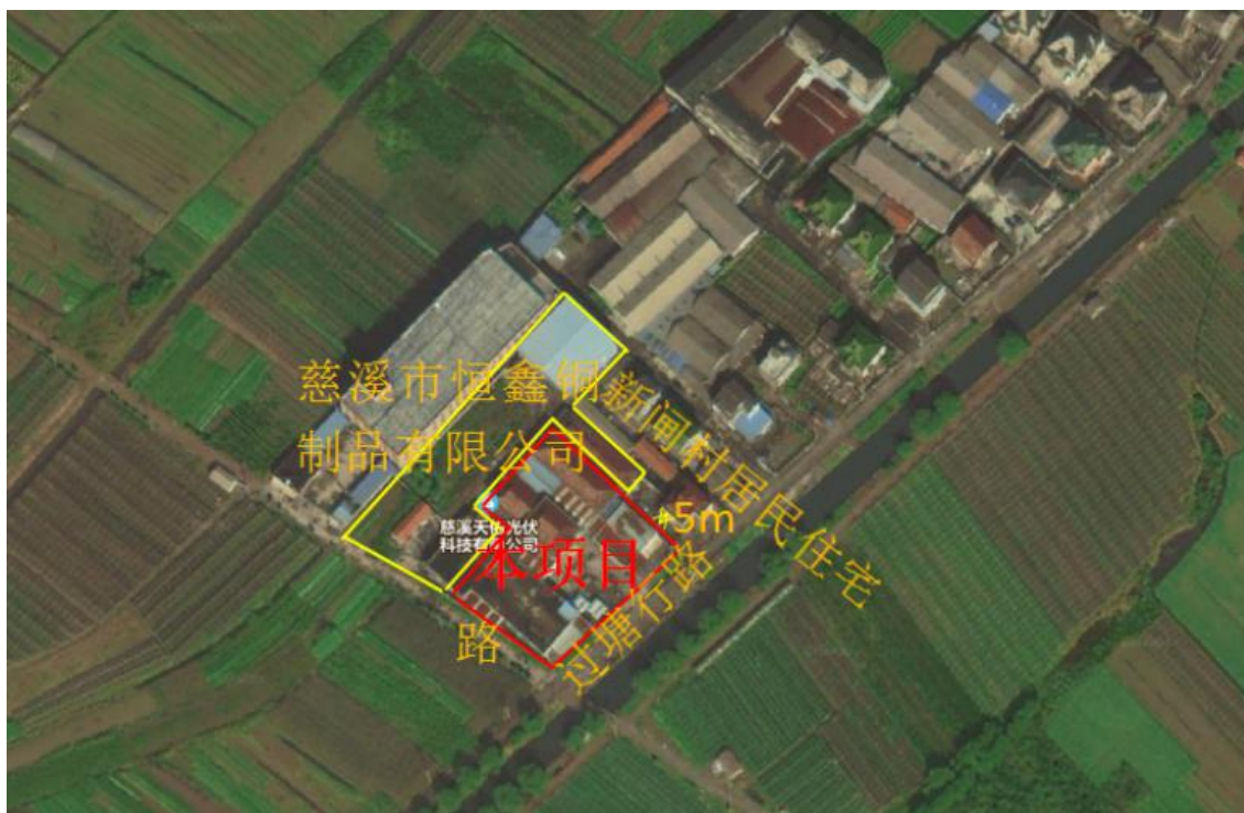
图 3-1 项目地理位置图