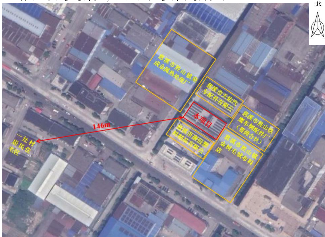
图 3-1 项目地理位置图