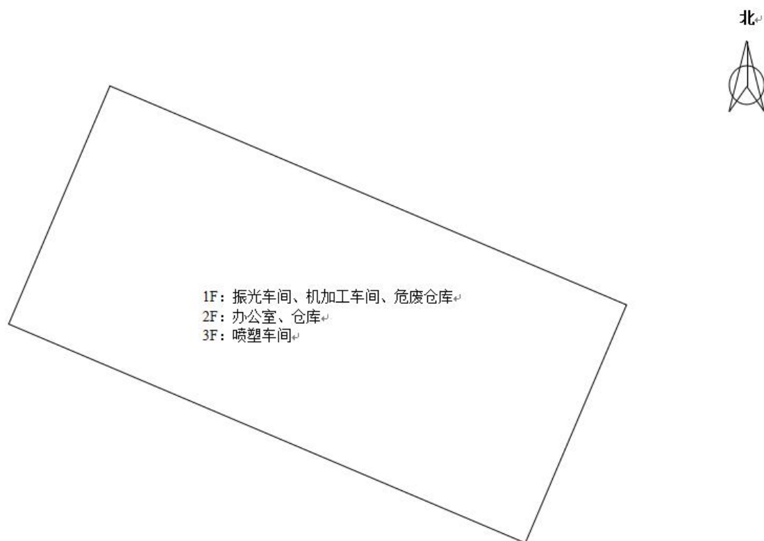
图 3-2 厂区平面布置图