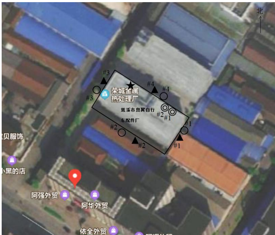
图 7-1 监测点位图