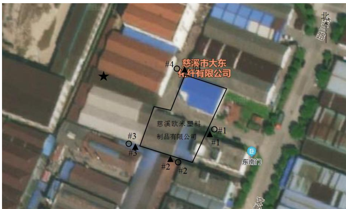
图 7-1 监测点位图