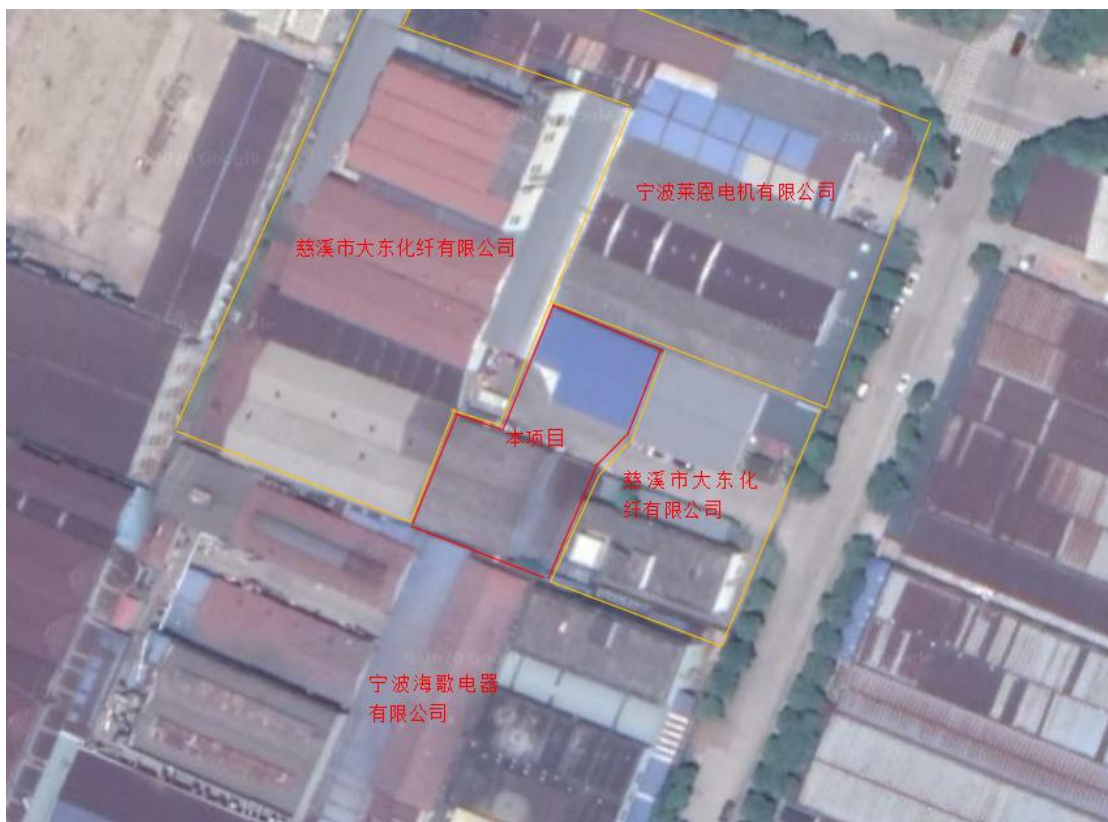
图 3-1 项目地理位置图