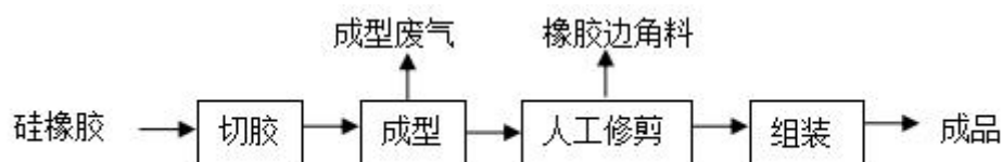
图 2-1 本项目生产工艺流程及产污节点图

(1) 本项目建成后，具有年产 100 万个饮水机硅胶管生产线建设项目的生产能力，生产工艺流程图及产污环节详见下图：