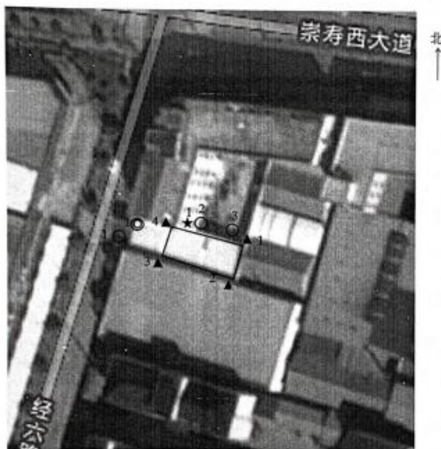
附 2: 测点示意图