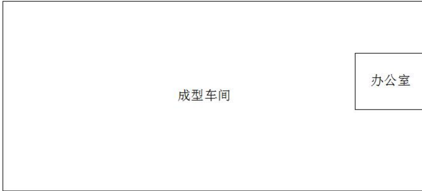
附图3 项目总平面布置图