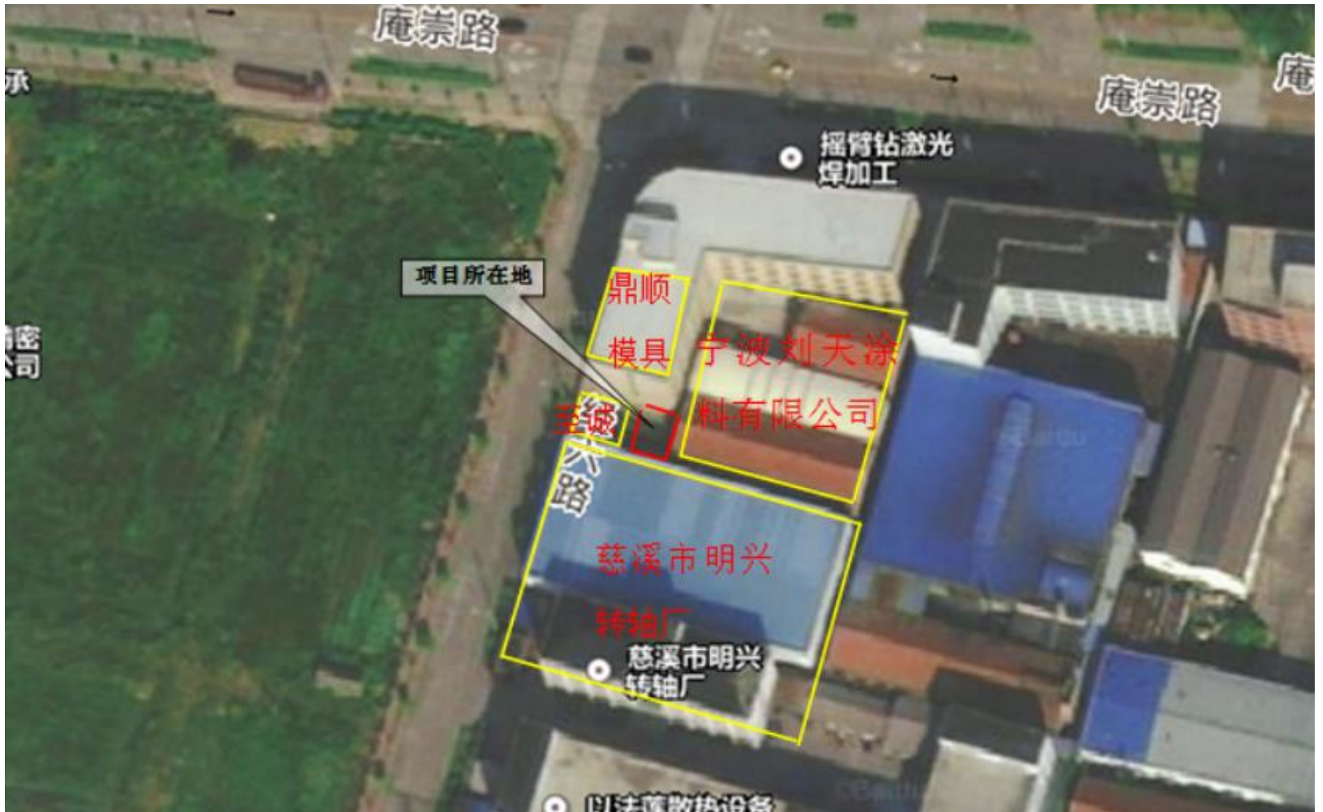
附图2 项目周边环境示意图