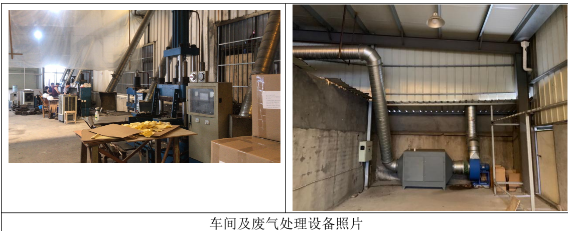
车间及废气处理设备照片