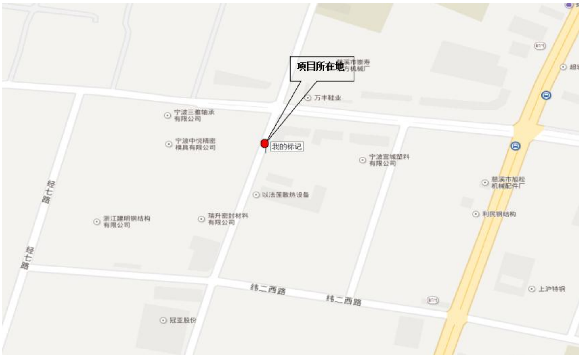
附图 1 项目地理位置图